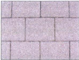
Beton-Pflaster mit Splittfuge