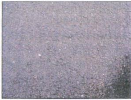
Fugenloser Belag, z.B. Asphalt oder Beton