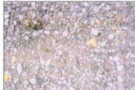
Kies oder Schotter